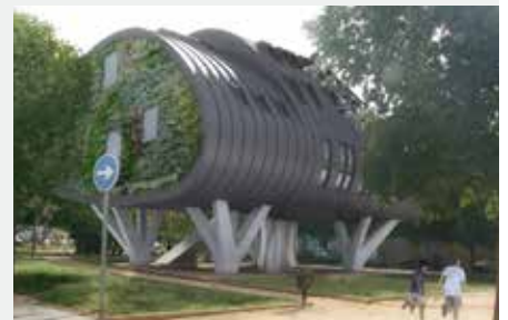
Edificio inteligente CSI Idea. Málaga

plantación de huertos urbanos. Valladolid Realizado con fines educativos en la Universidad de Valladolid, describe una serie de estudios sobre clima, técnicas agrarias, especies vegetales, suelos, sistemas de riego, controles de plagas, gestión y calendario.