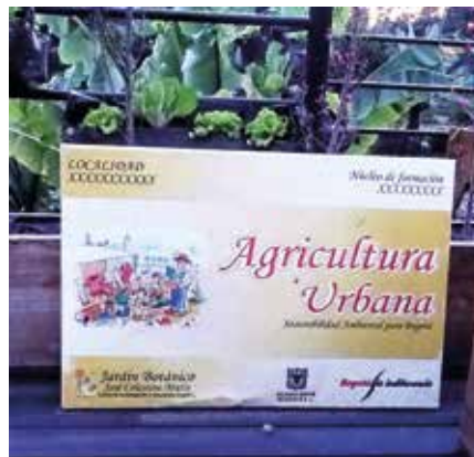
Agricultura urbana en el Botánico de Bogotá