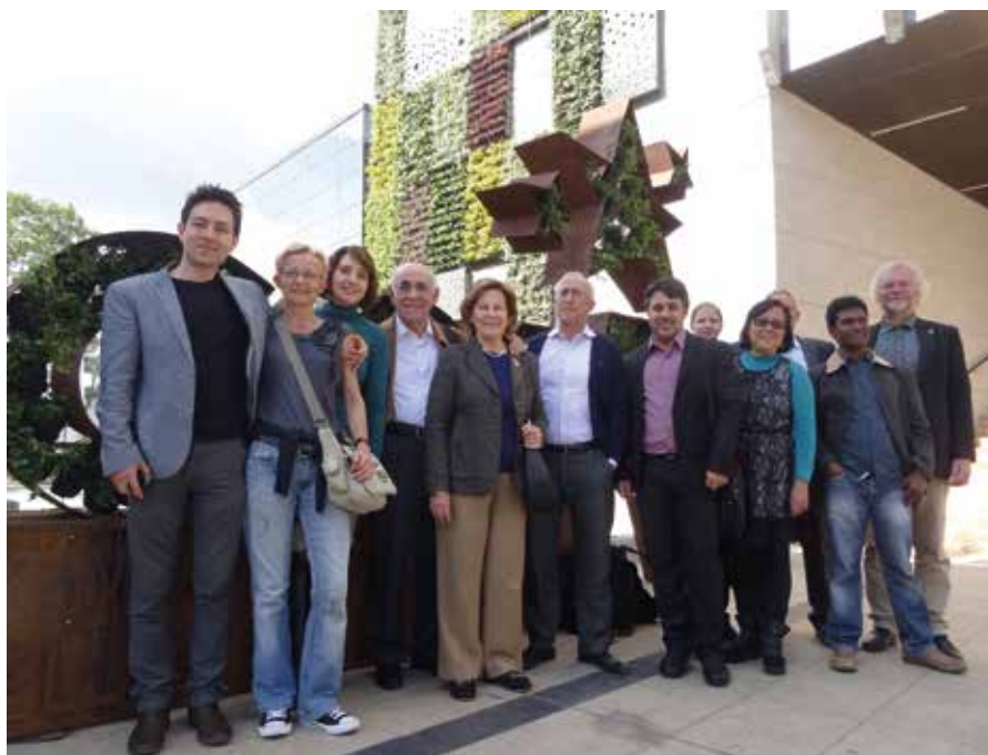
Entrada Congreso Ciudades Verdes en el mundo celebrado en Bogotá. 2016

Hay un proceso acelerado de movimientos migratorios del campo a la