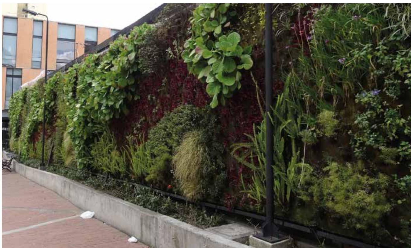
Pared verde. Bogotá

H ace pocos días, el pasado 9 de enero, nos dejó Zigmund Bauman reconocidísimo filósofo y sociólogo polaco, profesor universitario, autor de 57 libros, galardonado entre otras distinciones con el Premio Príncipe de Asturias 2010 de Comunicación y Humanidades y con el Premio Theodor W. Adorno de Alemania. Ha sido, quizás, el pensador que más